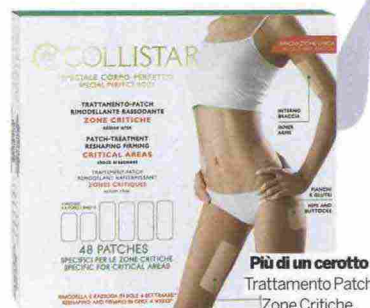
Più di un cerotto Trattamento Patch Zone Critiche, Collistar (€ 40,90).

Dedicati ai punti critici della silhouette come addome, interno cosce, parte inferiore delle braccia, si presentano sotto forma di patch adesivi dall'azione snellente. Si applicano in pochi secondi e, per le successive 8 ore, si dimenticano. I risultati non sono ovviamente miracolosi, ma si vedono. E per non lasciare nulla d'intentato, sfruttate anche la doccia, usando un bagnoschiuma in versione sliming.