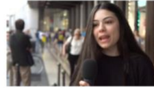
Vanity Fair Sun Silk You Populi