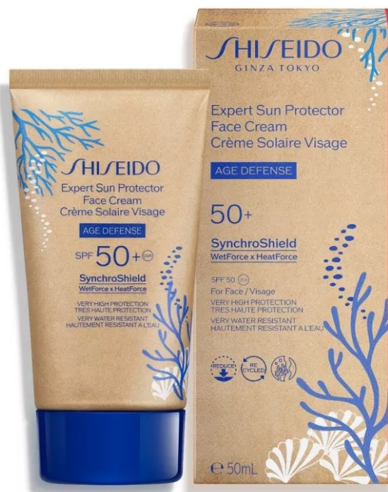
Expert Sun Protector Face Cream Spf 50+ di Shiseido

Expert Sun Protector Face Cream Spf 50+ di Shiseido: un potente scudo contro i raggi Uvb, combinato con un efficace filtro Uva (entrambi testati "Coral Safe"), per assicurare alla pelle protezione ad ampio spettro. Questo solare viso si basa sulla tecnologia SynchroShield, un velo protettivo che diventa più omogeneo e potente quando la pelle è esposta ad acqua o calore. Per questa edizione limitata si rinnova con un packaging più rispettoso dell'ambiente, con tubetti realizzati con il 48% in meno di plastica derivata dal petrolio. Inoltre, la sua formula è stata ricalibrata per ridurre la dispersione in mare.