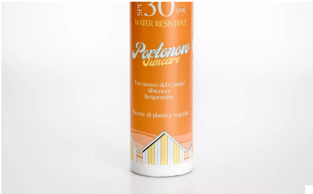
Latte Corpo Antiossidante Spf 30 di Portonovo Suncare

Expert Sun Protector Face Cream Spf 50+ di Shiseido: un potente scudo contro i raggi Uvb, combinato con un efficace filtro Uva (entrambi testati "Coral Safe"), per assicurare alla pelle protezione ad ampio spettro. Questo solare viso si basa sulla tecnologia SynchroShield, un velo protettivo che diventa più omogeneo e potente quando la pelle è esposta ad acqua o calore. Per questa edizione limitata si rinnova con un packaging più rispettoso dell'ambiente, con tubetti realizzati con il 48% in meno di plastica derivata dal petrolio. Inoltre, la sua formula è stata ricalibrata per ridurre la dispersione in mare.