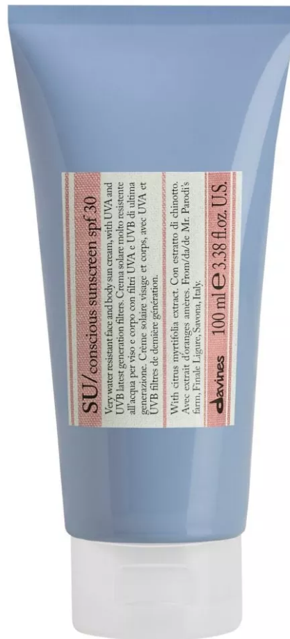
Su Conscious Sunscreen Spf 30 di Davines

Su Conscious Sunscreen Spf 30 di Davines: una crema solare resistente all'acqua con il 72% di ingredienti di origine naturale e filtri a minore tossicità acquatica, per un minore impatto ambientale. Arricchita con olio di abissinia, aiuta a rinforzare la barriera lipidica della pelle.