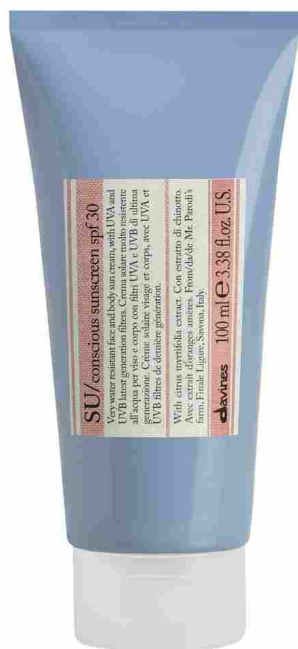
▲ Su Conscious Sunscreen Spf 30 di Davines

Latte Corpo Antiossidante Spf 30 di Portonovo Suncare: un latte protettivo antiossidante ed emolliente certificato "Coral Safe" perché testato per preservare gli ecosistemi marini. Il prodotto fa parte della nuova start up Conero Beauty nata sul Monte Conero, che utilizza estratti delle piante autoctone del Parco Naturale Regionale del Monte Conero, con una filiera produttiva interamente Made in Marche.