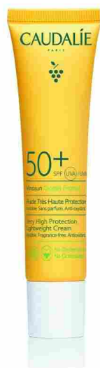
▲ Vinosun Fluide Très Haute Protection Spf 50+ di Caudalie

Sun Latte Spray Spf 50+ di Mediterranea: adatta dai 3 mesi in poi, protegge dai raggi del sole grazie a una formula innovativa con un sistema di protezione Uv ad ampio spettro, stabile e completo. La sua formula reef-friendly, resistente all'acqua e studiata per un effetto antisabbia miscela un prebiotico naturale che rinforza la barriera della pelle, l'estratto di aloe, l'olio di mandorle e la vitamina E.