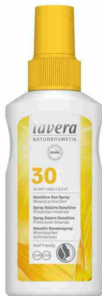
▲ Sensitive Sun Spray Spf 30 di Lavera