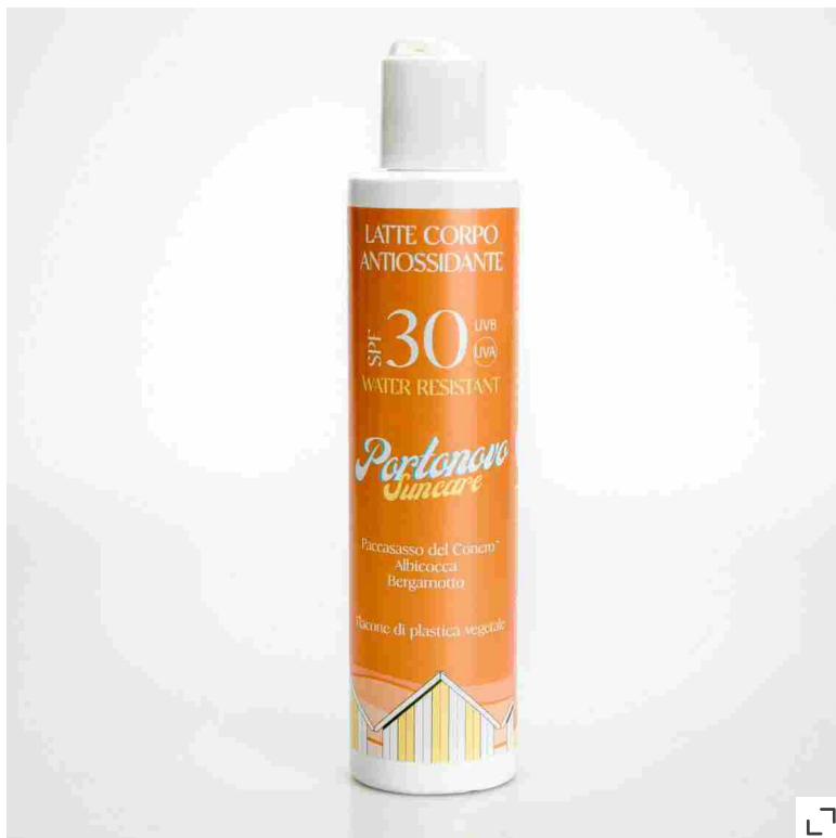
▲ Latte Corpo Antiossidante Spf 30 di Portonovo Suncare

Expert Sun Protector Face Cream Spf 50+ di Shiseido: un potente scudo contro i raggi Uvb, combinato con un efficace filtro Uva (entrambi testati "Coral Safe"), per assicurare alla pelle protezione ad ampio spettro. Questo solare viso si basa sulla tecnologia SynchroShield, un velo protettivo che diventa più omogeneo e potente quando la pelle è esposta ad acqua o calore. Per questa edizione limitata si rinnova con un packaging più rispettoso dell'ambiente, con tubetti realizzati con il 48% in meno di plastica derivata dal petrolio. Inoltre, la sua formula è stata ricalibrata per ridurre la dispersione in mare.