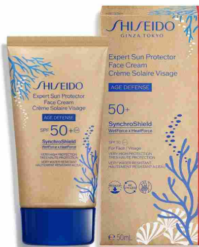
▲ Expert Sun Protector Face Cream Spf 50+ di Shiseido

Waterlover Sun Milk Spf 30 di Biotherm: con una formula base biodegradabile al 97% e flaconi in plastica riciclata al 100%, questa protezione solare è pensata per ridurre al minimo l'impatto ambientale sugli ecosistemi acquatici. Le materie prime accuratamente selezionate rispondono a rigorosi requisiti ambientali e chimici, certificati e controllati dal Nordic Swan Ecolabel, certificazione che valuta l'impatto ambientale dell'intero ciclo di vita di un prodotto.