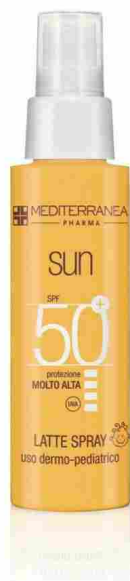
▲ Sun Latte Spray Spf 50+ di Mediterranea

Hair & Body Protective Lotion Spf 15 di My.Organics: grazie alla tecnologia brevettata EcoSun Pass, contiene un filtro ecologicamente migliorato che garantisce un'ottima compatibilità ambientale proteggendo l'ecosistema marino. La sua formula miscela aloe vera, malva e carota per rivitalizzare, lenire e contrastare l'azione dei radicali liberi.