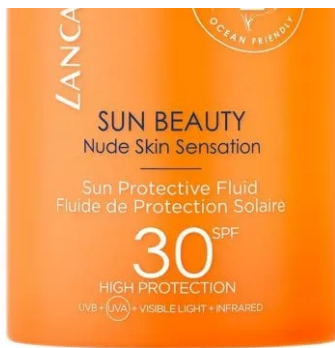
Sun Beauty Sun Protective Fluid Spf 30 di Lancaster

Sensitive Sun Spray Spf 30 di Lavera: la sua formula reef-friendly e resistente all'acqua contiene solo filtri minerali (ossido di zinco e ossido di titanio) in ottemperanza alle leggi Hawaiane a tutela della barriera corallina, senza conservanti, coloranti e microplastiche. Inoltre, è arricchita con olio di semi di girasole e di cocco bio.