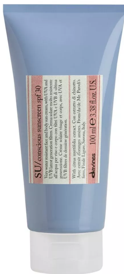
Su Conscious Sunscreen Spf 30 di Davines

Su Conscious Sunscreen Spf 30 di Davines: una crema solare resistente all'acqua con il 72% di ingredienti di origine naturale e filtri a minore tossicità acquatica, per un minore impatto ambientale. Arricchita con olio di abissinia, aiuta a rinforzare la barriera lipidica della pelle.