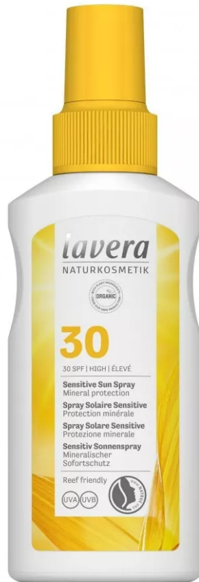
Sensitive Sun Spray Spf 30 di Lavera

Sensitive Sun Spray Spf 30 di Lavera: la sua formula reef-friendly e resistente all'acqua contiene solo filtri minerali (ossido di zinco e ossido di titanio) in ottemperanza alle leggi Hawaiane a tutela della barriera corallina, senza conservanti, coloranti e microplastiche. Inoltre, è arricchita con olio di semi di girasole e di cocco bio.