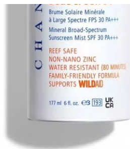
SeaScreen 30 Mineral Broad-Spectrum Sunscreen Mist SPF 30 PA+++ di Chantecaille

Su Conscious Sunscreen Spf 30 di Davines: una crema solare resistente all'acqua con il 72% di ingredienti di origine naturale e filtri a minore tossicità acquatica, per un minore impatto ambientale. Arricchita con olio di abissinia, aiuta a rinforzare la barriera lipidica della pelle.