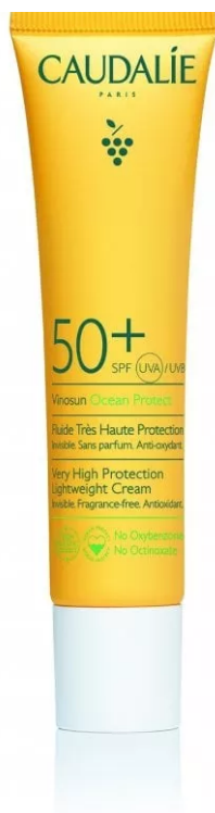
Vinosun Fluide Très Haute Protection Spf 50+ di Caudalie

Sun Latte Spray Spf 50+ di Mediterranea: adatta dai 3 mesi in poi, protegge dai raggi del sole grazie a una formula innovativa con un sistema di protezione Uv ad ampio spettro, stabile e completo. La sua formula reef-friendly, resistente all'acqua e studiata per un effetto antisabbia miscela un prebiotico naturale che rinforza la barriera della pelle, l'estratto di aloe, l'olio di mandrole e la vitamina E.