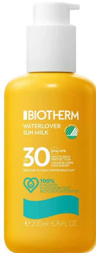
Waterlover Sun Milk Spf 30 di Biotherm

Waterlover Sun Milk Spf 30 di Biotherm: con una formula base biodegradabile al 97% e flaconi in plastica riciclata al 100%, questa protezione solare è pensata per ridurre al minimo l'impatto ambientale sugli ecosistemi acquatici. Le materie prime accuratamente selezionate rispondono a rigorosi requisiti ambientali e chimici, certificati e controllati dal Nordic Swan Ecolabel, certificazione che valuta l'impatto ambientale dell'intero ciclo di vita di un prodotto.