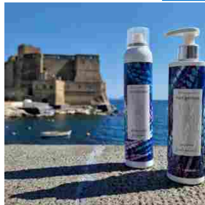
Parthenope, solari capelli per sirene LUGLIO 16, 2022

Se le chiome sono stoppose, perennemente opache e crespe, allora è arrivato il momento di ricorrere alla ricostruzione capelli in un buon salone d'acconciatura . Balsami e maschere applicati a casa, infatti, per quanto efficaci, non riescono a penetrare nella parte più interna dello stelo, per risanarlo.