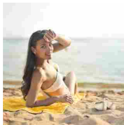
Capelli al sole: i consigli della tricologa LUGLIO 15, 2022