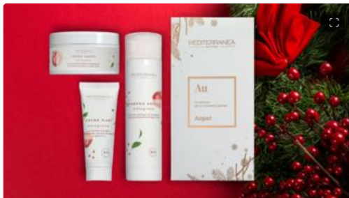
Natale: idee regalo beauty per tutte le tasche

Il melograno è un alleato della salute, grazie alle sue proprietà antiossidanti, ma anche del benessere della pelle. Mediterranea ne ha utilizzato l'estratto biologico, sapientemente miscelato ad altri ingredienti bio, per dare vita a al Cofanetto melograno (22,50 euro) con tre trattamenti per nutrire, vitaminizzare e mantenere morbida la pelle. Lo shampoo doccia rivitalizza la cute e agisce sui capelli rendendoli leggeri e rispettando il cuoio capelluto; la crema corpo nutriente, vitaminizzante e antiossidante, dalla texture soffice e vellutata; la crema mani idratante e protettiva, protegge e non unge.