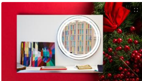
Natale: idee regalo beauty per tutte le tasche

I doni più belli – si sa – sono quelli cuciti su misura. Per questo, CITY LAB Cosmetics propone tre esperienze beauty da regalare, acquistabili presso lo store milanese di Corso Garibaldi 3 o online . Una di queste è l'esperienza Make up Armocromia (180 euro a persona, 40 minuti): attraverso l'analisi del mix pelle/occhi/capelli, si possono scoprire le tonalità in grado di esaltare i colori naturali del proprio viso. Al termine si riceve un report dettagliato per imparare a valorizzare la propria immagine, una palette di ombretti e un lipstick selezionati in base al risultato dell'analisi di armocromia.