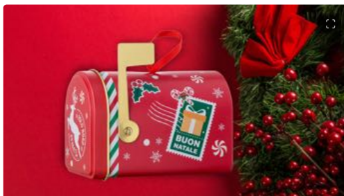
Natale: idee regalo beauty per tutte le tasche

Amiche, colleghe, conoscenti: chi ha tante persone alle quali augurare buon Natale con un piccolo dono può dare un'occhiata ai pensierini di Bottega Verde . 14 proposte colorate, che offrono una scelta di prodotti make up e skincare combinati con graziosissimi accessori. Quella nella foto, ad esempio, è la XMas Box Zenzero (9,99 euro), che contiene una crema mani e uno stick labbra, perfetti per andare incontro alla stagione più fredda.