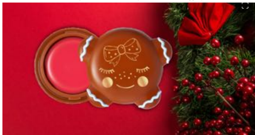
Natale: idee regalo beauty per tutte le tasche

C'è qualcosa di più natalizio del Cookies for Santa balsamo labbra pan di zenzero (2,49 euro) di essence ?