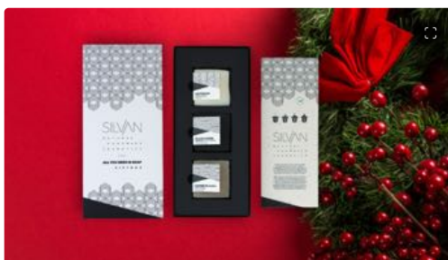
Natale: idee regalo beauty per tutte le tasche

Tutti i prodotti di Silvan , brand croato di cosmesi "solida", sono artigianali, realizzati in piccoli lotti per garantirne la freschezza, e creati con ingredienti naturali come oli saponificati, oli essenziali e additivi, tipo caffè macinato, sale marino e carbone attivo. Il set regalo All you need is soap (14 euro) è composto da tre saponi: Black & pure , un sapone solido per la detersione del viso al carbone attivo e all'olio dell'albero del tè; Daydream , un sapone solido per il corpo e le mani agli oli vegetali e alla lavanda; Coffee to grow , un sapone esfoliante per il corpo al caffè e arancia dolce. La confezione è fatta con una carta che si può piantare e la si può vedere crescere in bellissimi fiori selvatici.