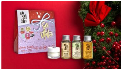
Natale: idee regalo beauty per tutte le tasche

Ispirandosi alla beauty routine coreana, il nuovo brand italiano Thaleae unisce l'alta tecnologia ai principi della natura, dando vita a una linea cosmetica dall'effetto detossinante e depurativo a livello epidermico. La centella asiatica, pianta millenaria originaria dell'Oriente, è l'ingrediente-chiave di tutti i prodotti proposti perché è un'alleata preziosa della pelle: aiuta, infatti, a stimolare la produzione di collagene e migliora la microcircolazione. Tra i cinque cofanetti natalizi di Thaleae c'è anche Sei Vitale (19,90 euro): una box con olio struccante bifasico occhi e viso, tonico ed essenza (in formato travel size) e Re-Calm crema nutriente viso, ideale per le pelli sensibili e secche, con una profumazione a base di rosa damascena per un effetto calmante.