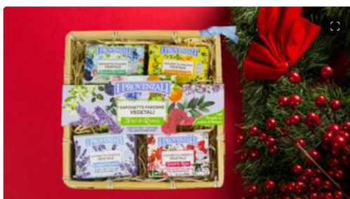
Natale: idee regalo beauty per tutte le tasche