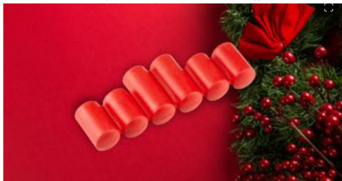
Natale: idee regalo beauty per tutte le tasche