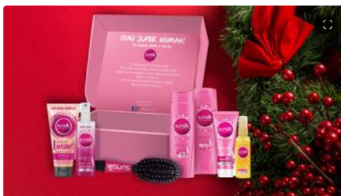
Natale: idee regalo beauty per tutte le tasche

Sunsilk ha pensato a tutte le "super donna", dedicando loro le Gift Box Super Woman, che contengono i prodotti necessari per una completa haircare routine e cinque consigli per prendersi cura delle proprie chiome. La box Scintille di Luce (24,90 euro), ad esempio, è composta da shampoo e balsamo con formula Active Fusion, ideale per donare ai capelli extra-brillantezza e combattere l'effetto crespo, il trattamento intensivo 1 Minute Wow, perfetto per capelli spenti e danneggiati, la crema disciplinante senza risciacquo, che disciplina tutte le chiome, il glossy spray, per un gesto di brillantezza istantanea, e l'olio nutriente, che protegge i capelli dai raggi solari, rendendoli morbidi, idratati e luminosi.