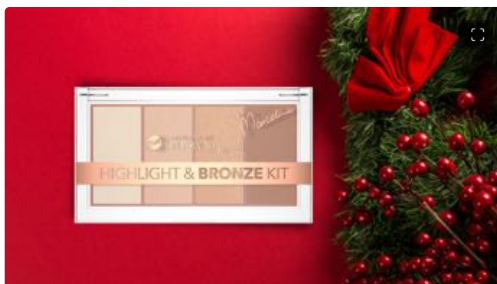
Natale: idee regalo beauty per tutte le tasche

Bell Hypoallergenic , il brand polacco di specializzato in make-up ipoallergenico per chi soffre di problemi di ipersensibilità cutanea, propone cosmetici versatili e comodamente mixabili tra di loro, in grado di lasciare tutti a bocca aperta durante i giorni più attesi dell'anno. Tra questi c'è anche la palette Highlight & Bronze kit (19,90 euro): un set di terre abbronzanti mat e illuminanti, composto da polveri leggerissime e dalla texture morbida.