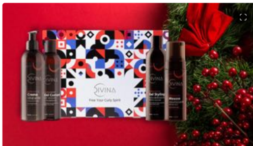
Natale: idee regalo beauty per tutte le tasche

Il capello riccio, mosso o afro può diventare la chiave per il regalo perfetto. In che modo? Scegliendo una delle tre box Divina BLK , studiate per andare incontro alle diverse esigenze, come idratazione, rigenerazione e styling, di chi ha chiome indomabili. La Curl Box Styling (70,50 euro), ad esempio, contiene la crema idratante leave-in, la mousse attiva-ricci, il gel styling e il custard gel da utilizzare nella fase di styling, per regalare ai ricci definizione e volume. Ideale per gestire l'effetto crespo e dare vita ad acconciature sia con i capelli sciolti che raccolti.