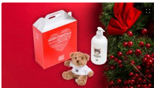
Natale: idee regalo beauty per tutte le tasche