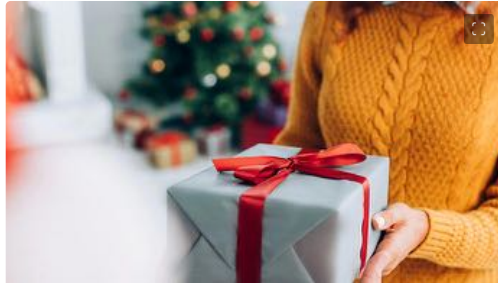
Natale: idee regalo beauty

Per tutte le tasche e, soprattutto, per ogni gusto e necessità. Le idee regalo beauty per il Natale 2022 , che strizzano sempre di più l'occhio ad ambiente e sostenibilità, riescono ad accontentare anche le persone più esigenti, offrendo soluzioni skincare, haircare e make up versatili, originali, in grado di stupire.