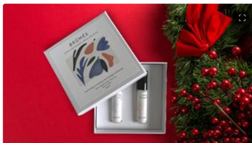
Natale: idee regalo beauty per tutte le tasche

L'innovazione di Brûmée sta tutta nella formulazione: niente sostanze chimiche artificiali ma solo oli organici ricostituenti e fragranze naturali. Da qui nasce una gamma di profumi d'autore unisex che rispetta la pelle, è vegana, certificata naturale e prodotta in Francia. Il set regalo Una notte in Provenza (28 euro) contiene due fragranze: neroli & bergamotto e fico & tè verde. Si tratta di due profumi androgini, perfettamente equilibrati e rinfrescanti, da spruzzare sulla pelle e vaporizzare tra i capelli.