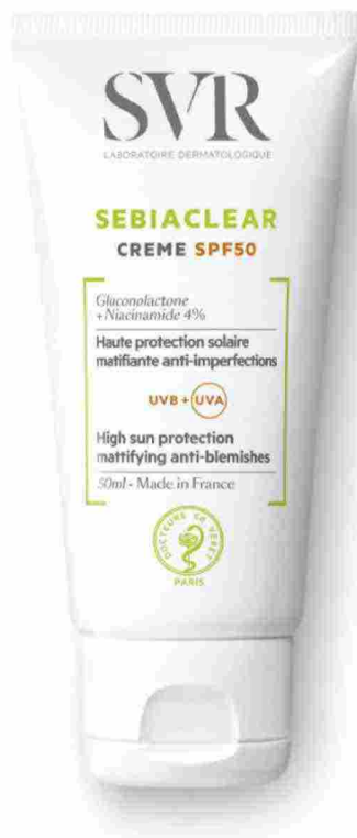
Sebiaclear, crème SPF50+, SVR

Protegge dai raggi solari e corregge le imperfezioni tipiche della pelle mista, grassa e a tendenza acneica.