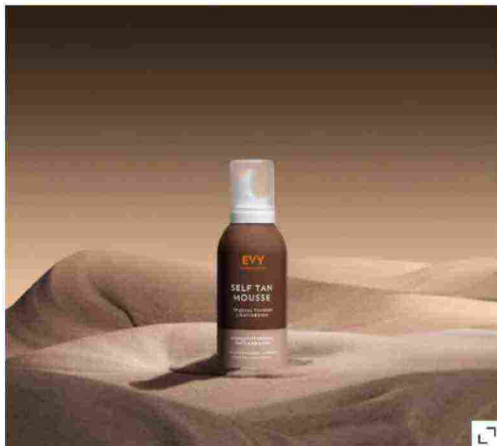
Self Tan Mousse di Evy

Dalla texture liscia e setosa, può essere utilizzato anche prima di applicare il make-up e la crema solare. Arricchito con anti-ossidanti ed ingredienti dalle proprietà curative ed anti-età, questa mousse protegge inoltre dallo stress dei raggi UV e dall'invecchiamento precoce. Risultati visibili già dopo due o quattro ore dall'applicazione. L'incarnato risulterà dorato e l'effetto finale, super naturale.