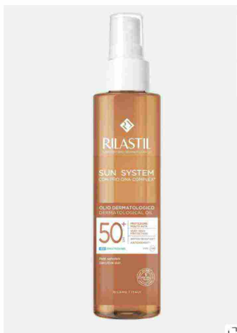
Sun System Olio Dermatologico SPF 50+, Rilastil

Questo prodotto offre una protezione solare efficace e un'idratazione prolungata fino a 8 ore, grazie alla sua formula arricchita con ingredienti attivi, come il Pro-DNA Complex noto per la sua proprietà antiossidante. Inoltre, grazie alla speciale tecnologia easy dry, è facile da applicare, si assorbe rapidamente senza lasciare residui ed è resistente all'acqua. Il flacone semi-trasparente con spray pump e il packaging senza imballaggio secondario rendono l'applicazione del prodotto ancora più comoda e rispecchiano l'impegno del marchio verso l'ecosistema.