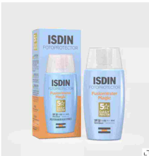
Fusion Water Magic, ISDIN

Ultraleggero con fase esterna acquosa e di uso quotidiano, si fonde sulla pelle senza lasciare residui grassi. È il fotoprotettore pensato per l'esposizione al sole durante le attività all'aperto. Contiene anche acido ialuronico, vitamina E e la formula è rafforzata da un ingrediente naturale ad azione antiossidante.