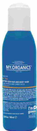
Dopo sole corpo e capelli, My.Organics