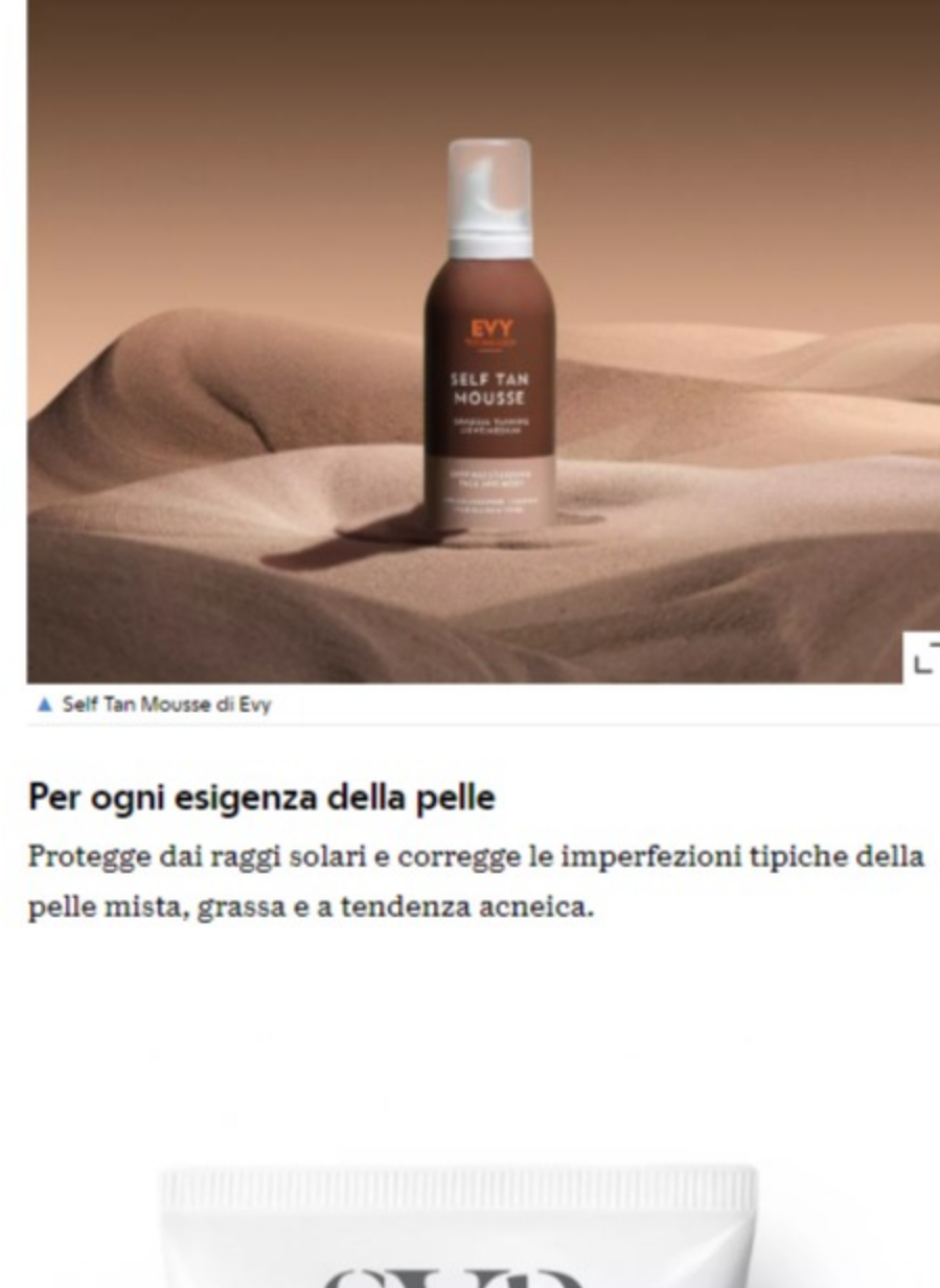
A Self Tan Mousse di Evy

Dalla texture liscia e setosa, può essere utilizzato anche prima di applicare il make-up e la crema solare. Arricchito con anti-ossidanti ed ingredienti dalle proprietà curative ed anti-età, questa mousse protegge inoltre dallo stress dei raggi UV e dall'invecchiamento precoce. Risultati visibili già dopo due o quattro ore dall'applicazione. L'incarnato risulterà dorato e l'effetto finale, super naturale.