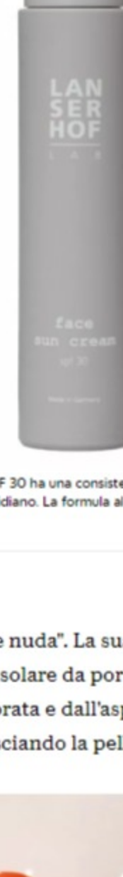
A L'anserhof Lab Face Sun Cream SPF 30 ha una consistenza piacevolmente vellutata e non grassa, ed è ideale per l'utilizzo quotidiano. La formula al 100% vegana è racchiusa in un flacone in vetro riciclabile.

Dai molteplici benefici: ha proprietà lenitive, protegge la pelle dai radicali liberi e dall'aggressione dei fattori esterni e aiuta a prevenire la comparsa di macchie cutanee.