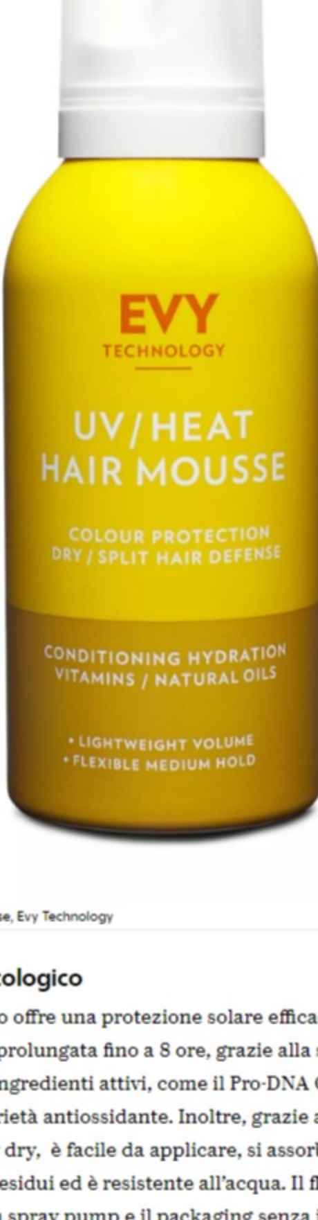
A UV/Heat Hair mousse, Evy Technology

Un prodotto multifunzione per la cura dei capelli. Agisce sia come mousse per lo styling, che come difesa dei raggi UV e come termoprotettore su oltre 120 gradi celsius. Con i suoi filtri UV, protegge i capelli dalla disidratazione e dalla luce solare. Ricco di vitamine B 3/5/6, vitamina C ed oli idratanti, aiuta i capelli a mantenere colore e lucentezza. Formula leggera e quella di un balsamo.