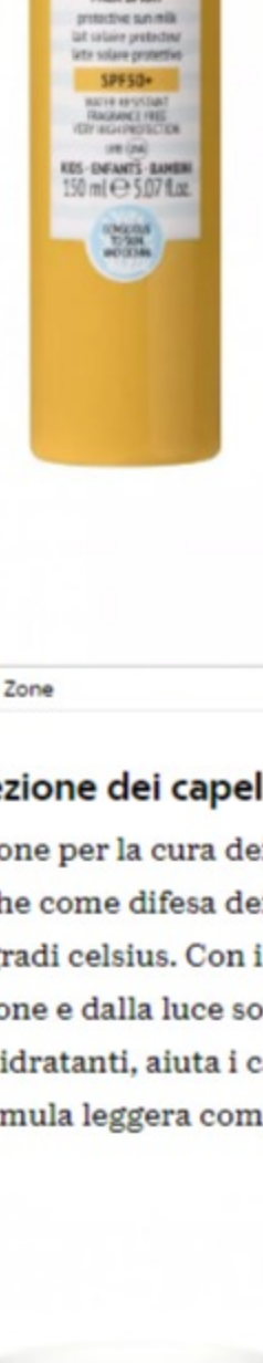
A Latte solare protettivo, Comfort Zone

Idrata e lenisce oltre a proteggere; nasce per i bimbi, ma può essere usato anche da chi ha la pelle delicata.