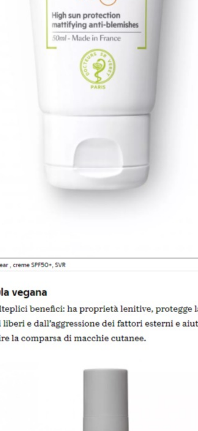
A Sebiaclear, crema SPF50+, SVR

Protegge dai raggi solari e corregge le imperfezioni tipiche della pelle mista, grassa e a tendenza acneica.