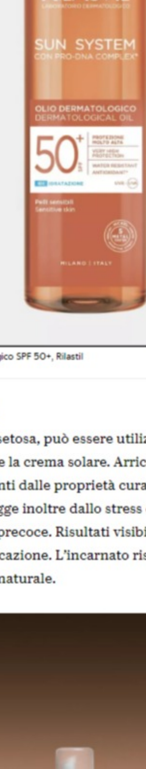
A Sun System Olio Dermatologico SPF 50+, Rilastil

Questo prodotto offre una protezione efficace e un'idratazione prolungata fino a 8 ore, grazie alla sua formula arricchita con ingredienti attivi, come il Pro-DNA Complex noto per la sua proprietà antiossidante. Inoltre, grazie alla speciale tecnologia easy dry, è facile da applicare, si assorbe rapidamente senza lasciare residui ed è resistente all'acqua. Il flacone semitrasparente con spray pump e il packaging senza imballaggio secondario rendono l'applicazione del prodotto ancora più comoda e rispecchiano l'impegno del marchio verso l'ecosistema.