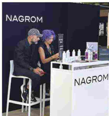
Nagrom si presenta a MCB 2023 con l'intera linea hair care parica, funzionale e il più naturale possibile. Si divide in sette referenze: ricostruzione, idratazione, sebo regolatore/ anti-forfora, calmante, colore, anticaduta, linea solare. Oltre che lo il prodotto di lancio nel 2012 Nagrom black, uno smacchiatore per la pelle efficace ricavato dal riciclo della cenere.

Vitality's ha presentato Espresso un trattamento colorante e ristrutturante in soli 5 minuti, il tempo di un caffè. Vitality's recupera da un'azienda del territorio le parti inutilizzate del caffè e, in collaborazione con una Cleantech Company torinese (azienda a basso impatto ambientale focalizzata sulla ricerca e lo sviluppo di tecniche estrattive), realizza il principio attivo esclusivo di Espresso, il RE-CUP COFFEE.