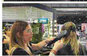
ghd duet style, piastra asciugacapelli 2 in 1 ad aria calda che trasforma i capelli da bagnati ad una piega perfetta, ha vinto Grand Prix de l'Innovation nella categoria accessori.