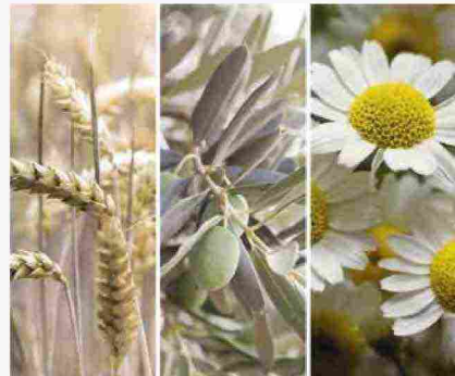
Avena, foglia di olivo e camomilla

efficace nel trattamento delle pelli sensibili, ha effetti astringenti che leniscono rossori e irritazioni, reazioni allergiche e dermatiti.